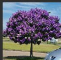
Quaresmeira ( Tibouchina granulosa )