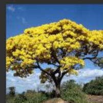
Ipê-amarelo ( Handroanthus ochraceus )