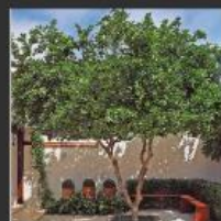
Pitangueira ( Eugenia uniflora )