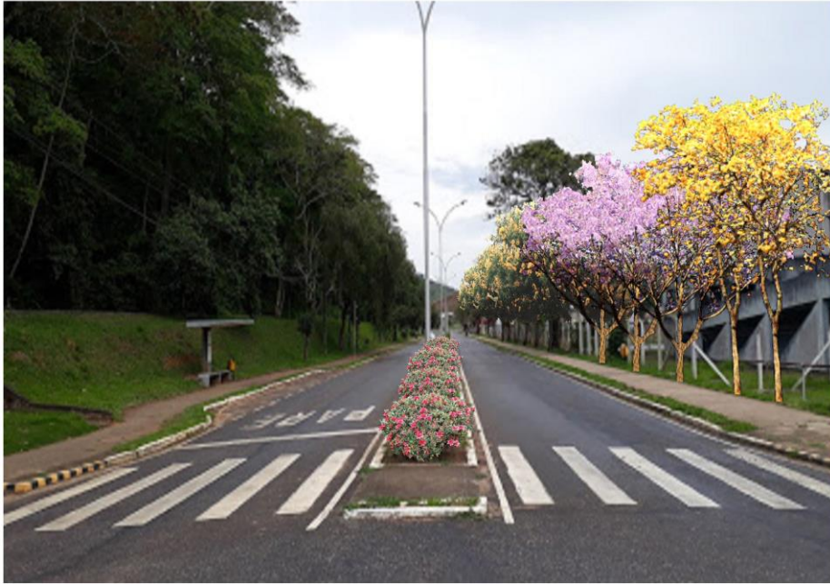
Trecho Caixa - LESA (previsão)