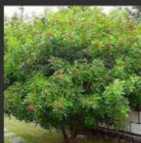
Aroeira-mansa ( Schinus terebinthifolia )

(Segue os mesmos critérios de escolha de espécies proposto para o bosque)