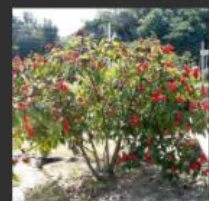
Urucum ( Bixa orellana )